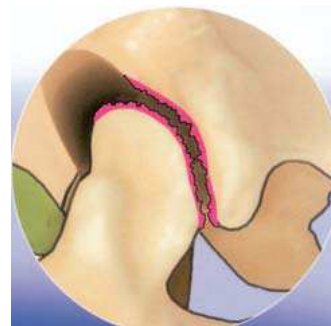
Arthrotisch veränderter Knorpel