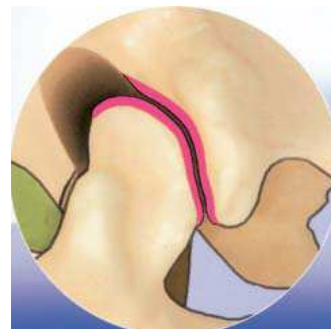
Gesunder Knorpel mit seinen gelenkbildenden Facetten