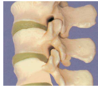
Arthrose kleiner Wirbelgelenke (Facettenarthrose)

Wird eine solche Therapie mit Hyaluronsäure durchgeführt, sollten Präparate zum Einsatz gelangen, welche die hochmolekulare Hyaluronsäure enthalten, deren physikalische und chemische Eigenschaften vergleichbar sind mit denen der Hyaluronsäure aus der gesunden Gelenkflüssigkeit. Arzt und Patient sollten sich jedoch bewusst sein, dass die erzielten Wirkungen zeitlich begrenzt und daher in regelmäßigen Abständen zu wiederholen sind. Auch im Anschluss an diese Injektion hat sich die Proliferationstherapie bestens bewährt.